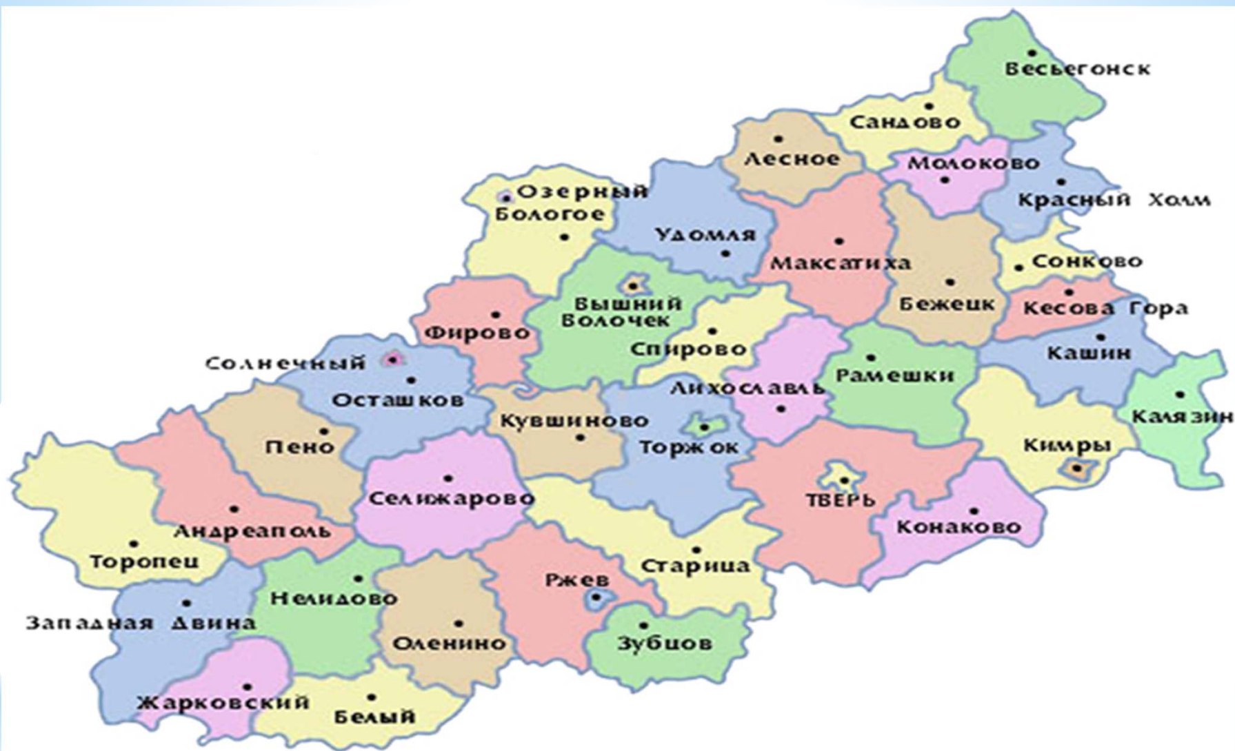
Рисунок 1 - Площадь земельного фонда Тверской области на 1 января 2016 г. - 8420 тыс. га.