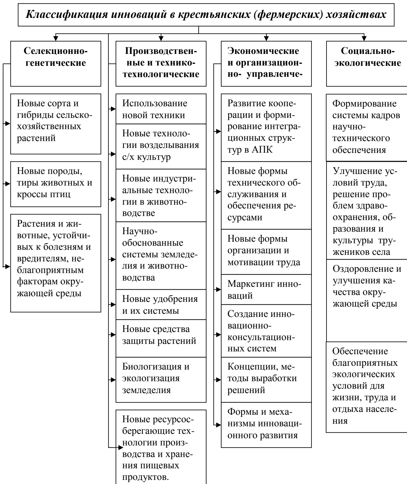
Рисунок 2 – Классификация инноваций в крестьянских (фермерских) хозяйствах

Проведенное моделирование условий и факторов функционирования крестьянских (фермерских) хозяйств позволила определить прогнозные параметры развития основных сельскохозяйственных отраслей (таблица 5).