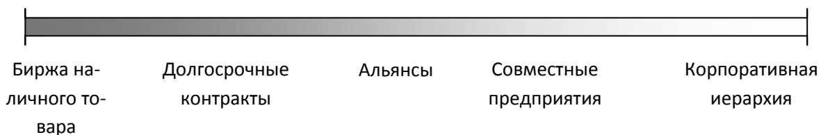
Рис.2 Спектр управленческих услуг.

В этой связи, соотношение крупного и малого бизнеса есть оценка всего диапазона альтернатив, располагающегося между рынком, с одной стороны, и фирмой, с другой, показаны на рисунке 2.